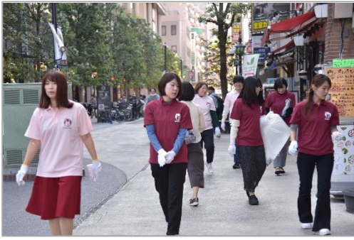
▲商店街での清掃の様子