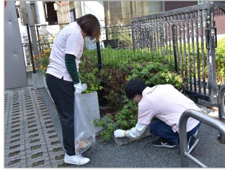
▲植木の隙間にも多くのごみを発見